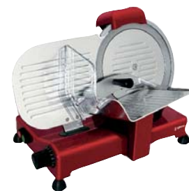
Baza lakierowana na czerwono CGSP-250-R E