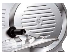
Stały pierścień ochronny