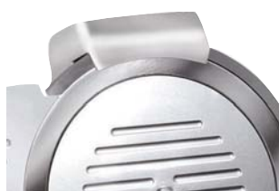
Wbudowana ostrzałka (za wyjątkiem CGSP-195 E)