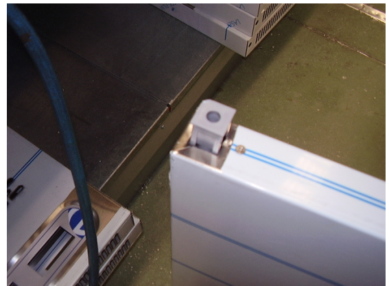
PASO 4: Los herrajes se deben de extraer y cambiar el de arriba abajo y viceversa