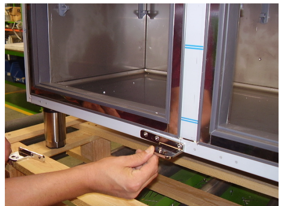
PASO 5: Cambio de soporte bisagra de apertura a izquierdas 6033010098 a derechas 6033010099