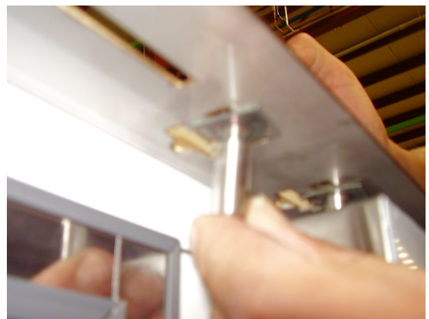
PASO 3: Arandela doble – roscada Enroscar el bulón-pasador de la puerta, como consecuencia, la chapa inferior y superior de la arandela hacen apriete con la pletina quedando está bien amarrada a la pletina