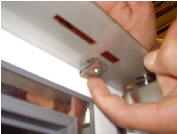
PASO 1: Arandela doble – roscada Introducir chapa inferior debajo de la pletina y superior encima de la pletina

La solución a dicho problema ha sido la introducción de una especie de arandela doble – Código 6025130045 –Tuerca rápida (una chapa superior y una inferior- sándwich) roscada en la base del refuerzo de la encimera que hace juego con un bulón roscado (Código 6033090104) y por último, un cambio del herraje de las puertas. A continuación se detallan los cambios.