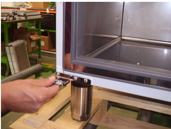
PASO 5: Cambio de soporte bisagra de apertura a izquierdas 6033010098 a derechas 6033010099