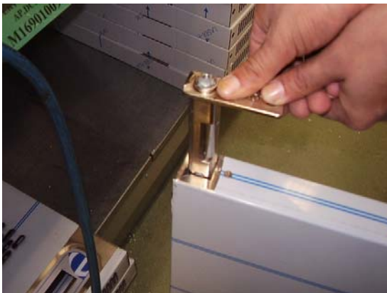
PASO 4: Los herrajes se deben de extraer y cambiar el de arriba abajo y viceversa