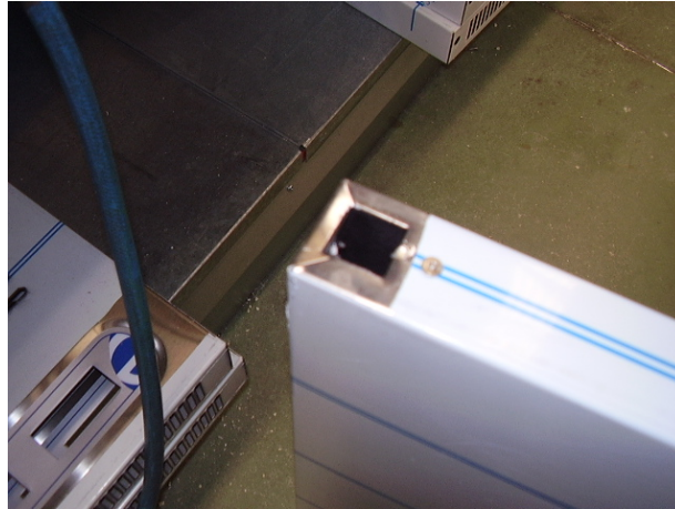
Imagen hueco herrajes en Puerta reversible