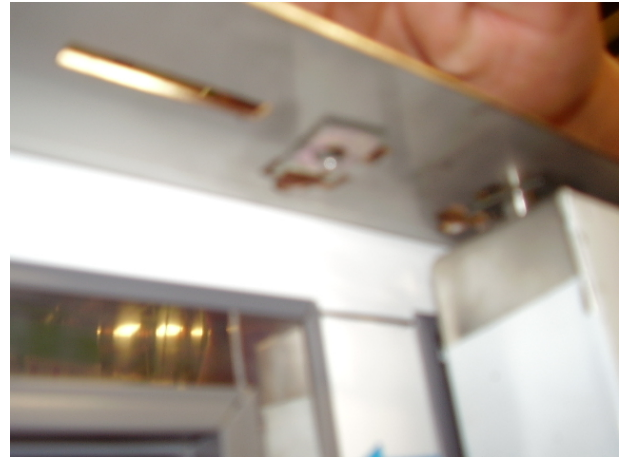
PASO 2: Arandela doble – roscada Chapa inferior debe de quedar abajo