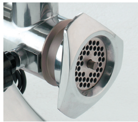
Detalle de la boca.