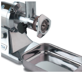
Con bandeja de recogida en acero inoxidable incorporada.