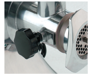
Completamente desmontable para una fácil limpieza.