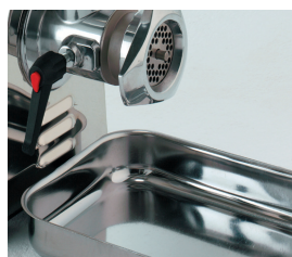
Bandeja de recogida en acero inox.