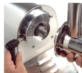
Modelo PI-32 con boca fácilmente desmontable para su limpieza.