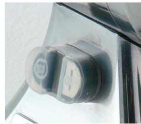
Interruptor marcha-paro con relé.