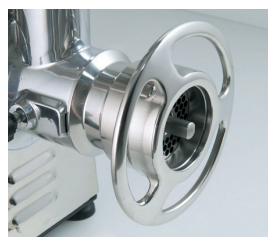
Detalle de la boca de la PI-22-U con sistema 1/2 Unger.